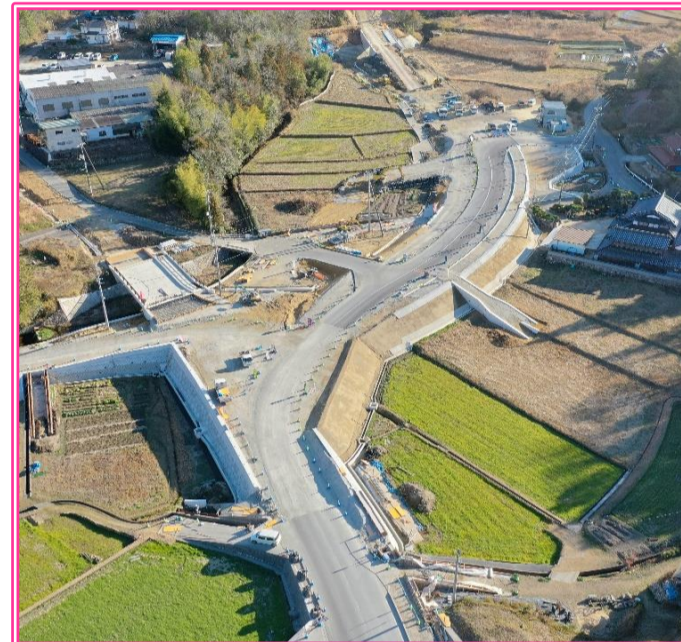
* 町道深原公園線 (R5) 道路改良工事 *

* ようやく完成の形が見えてきました。通行される方には、もうしばらくご迷惑をお掛けするかもしれませんがご協力をお願いいたします。